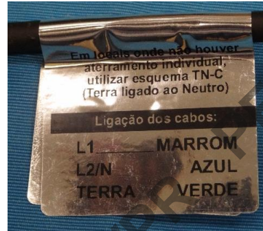
Foto 8 - Fiação externa da amostra.