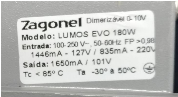
Foto 7 - Etiqueta do controlador da amostra.