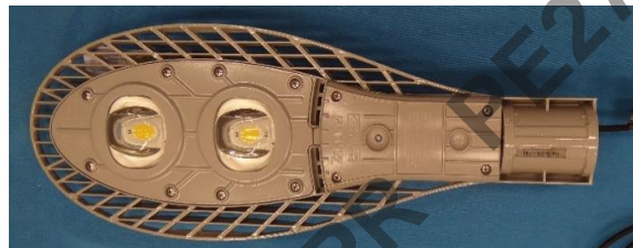
Foto 2 - Vista inferior da amostra.