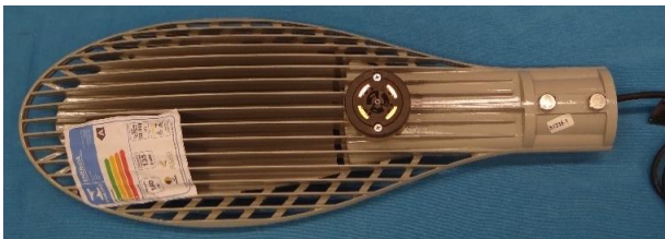
Foto 1 - Vista superior da amostra