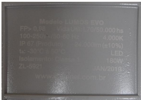
Foto 3 - Placa de identificação da amostra.